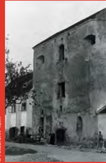
Vollständig erhaltener Römerturm, um 1918