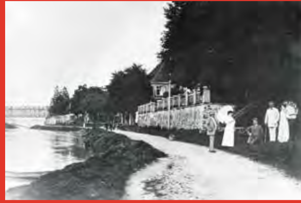
Donaulände, um 1900