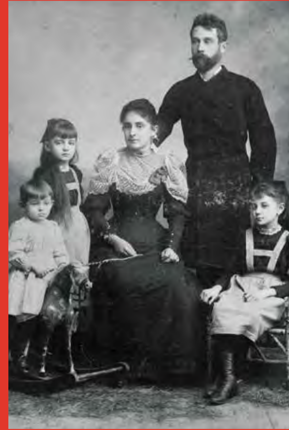
Familie Schiele, um 1893

Auf diesem Friedhof ruht die Familie des berühmten Künstlers Egon Schiele, der am 12. Juni 1890 in Tulln geboren wurde. Im Grab der Familie Schiele bestattet wurden Egons Eltern Adolf (1850-1905) und Marie (1862-1935) sowie seine ältere Schwester Elvira (1883-1893).