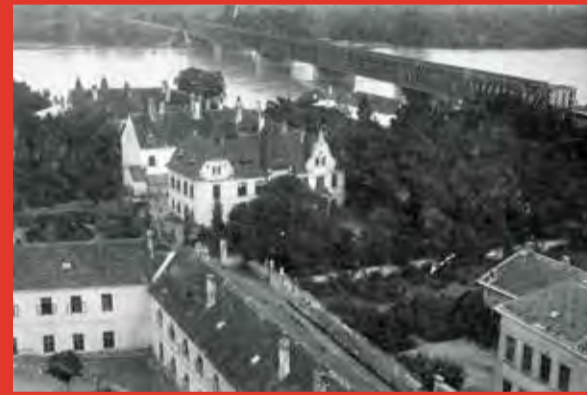
Ehemaliges Sanatorium / Römermuseum