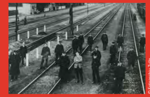
Gleisanlagen des Hauptbahnhofes, um 1900

Geburtshaus oder: Egon und die alten Dampfloks